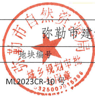
弥勒市建设用地规划条件表