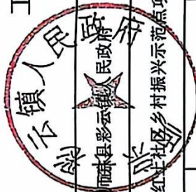
工程建设类项目信息表