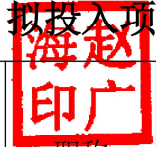
十、拟投入项目团队专业及人员（管理）人员基本情况表