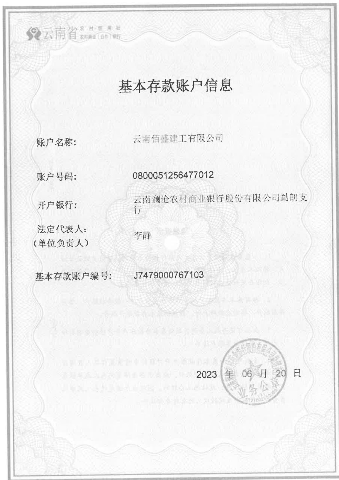
附件 2:委托单位及代理人开户许可证扫描件（加盖公章）