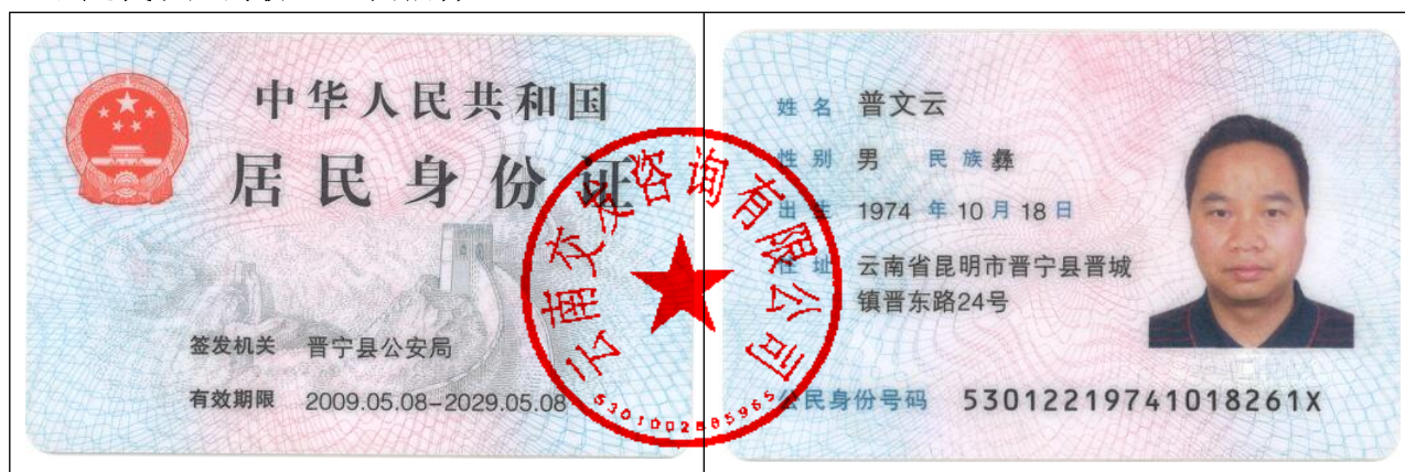
法定代表人身份证（扫描件）