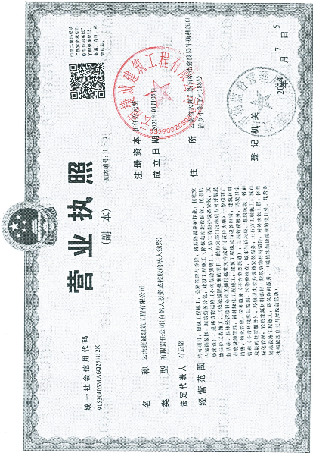
附件 1：云南捷诚建筑工程有限公司营业执照复印件

国家企业信用信息公示系统网址: http://yn.gsxt.gov.cn 请于每年1月1日至30日在国家企业信用信息公示系统（云南）报送上一年度年报并公示，当年设立登记的，自下一年起报送并公示，逾期未年报的，将依法处理。