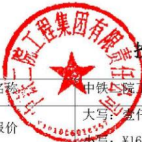
投标人信息汇总表