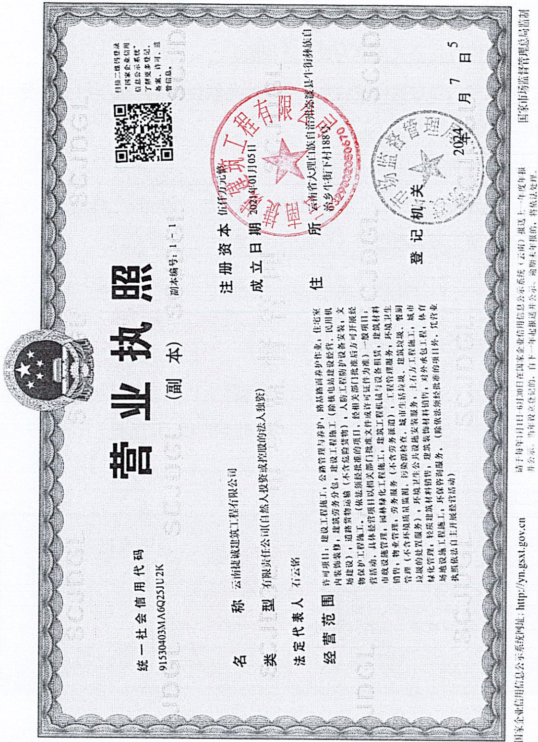
附件 1：云南捷诚建筑工程有限公司营业执照复印件