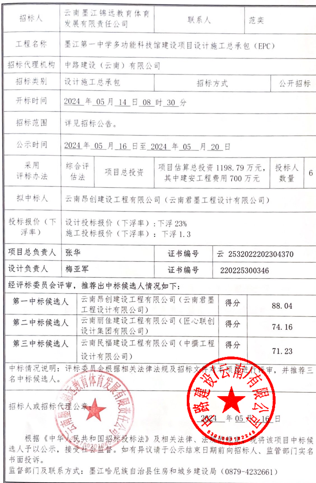
中标候选人公示发布登记表