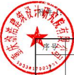
拟投入本项目人员基本情况表