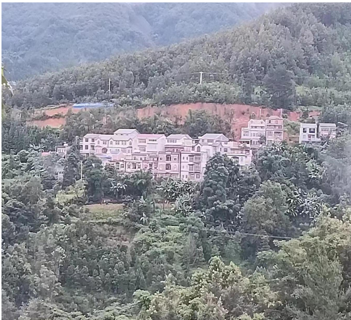
( 图为平拉村全貌图 )