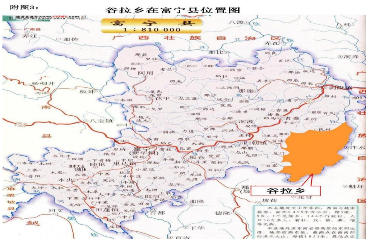
(图为谷拉乡区位图)