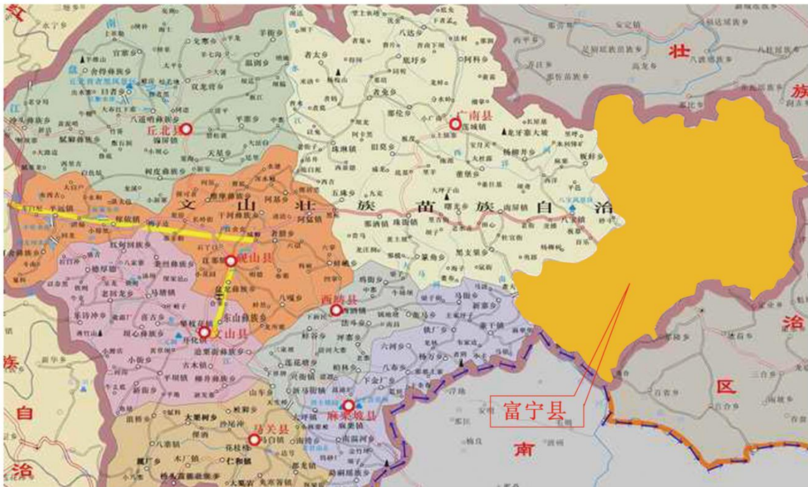
(图为富宁县区位图)