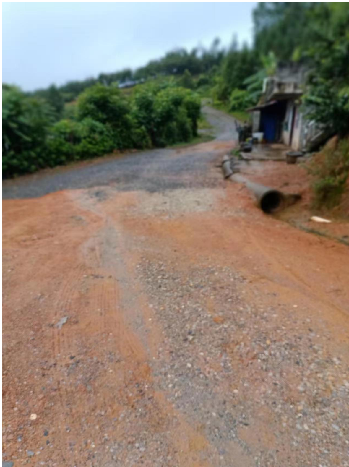
（图为平拉村村内现状图）