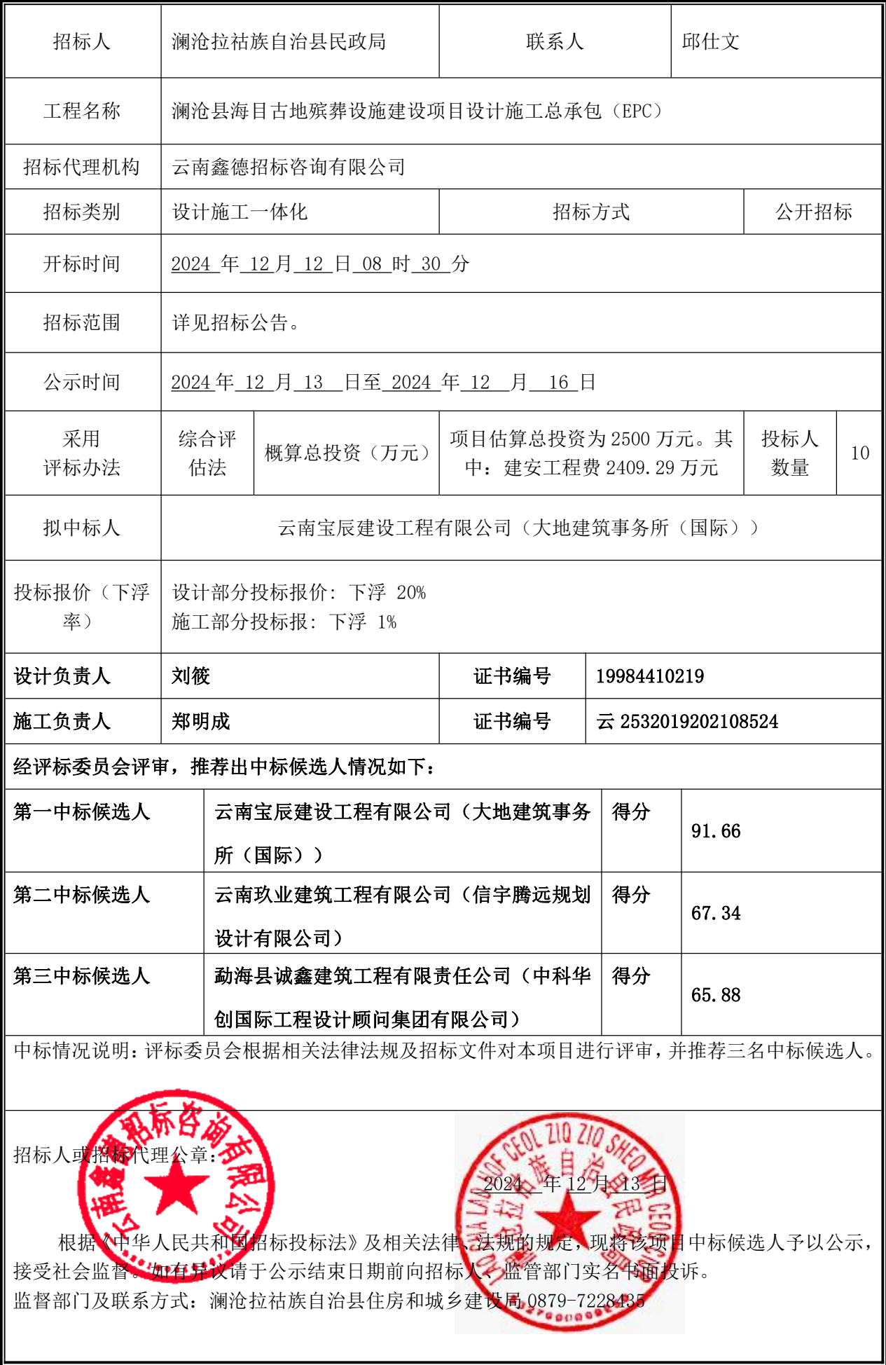
中标候选人公示发布登记表